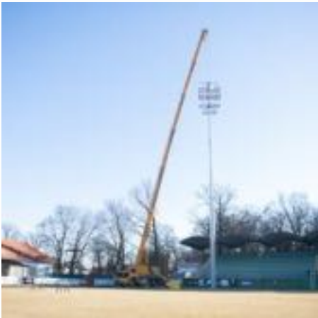
FOTO: Na Fazaneriji postavili zadnji reflektor