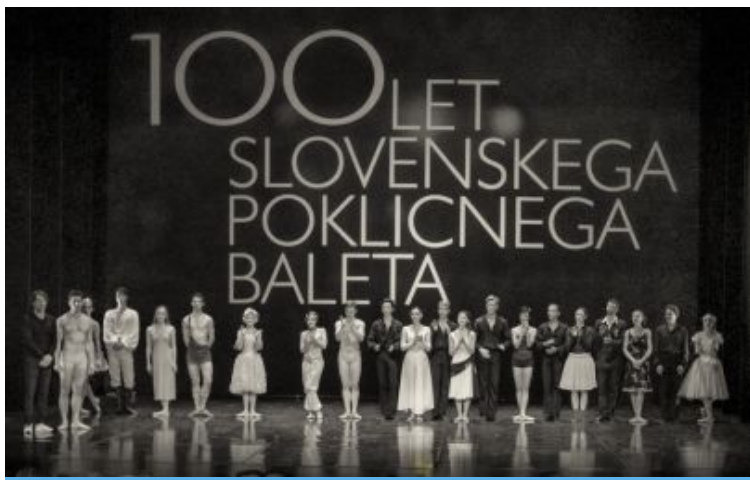
Nastopajoči na gala koncertu