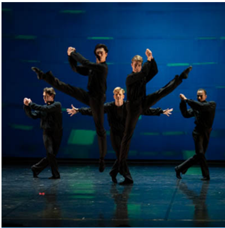
Simfonija Janeza Mejača v izvedbi ljubljanskih baletnikov