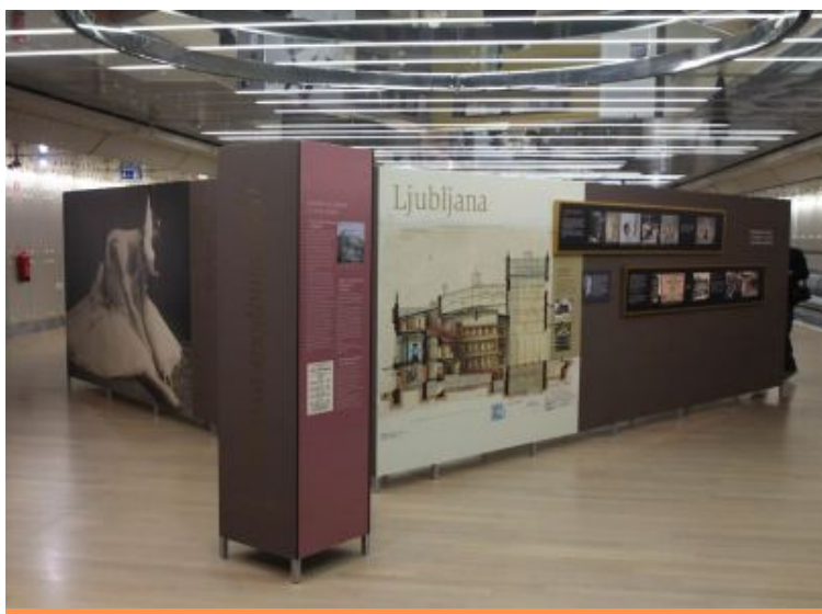
Razstava ob 100-letnici baleta v Cankarjevem domu

Naslednji korak DUBUS je stekel ob majski postavitvi pregledne fotografske razstave, 100-letnega vpogleda v slovensko poklicno baletno umetnost ter ustvarjalnost baletnih umetnikov. Obsežna razstava je ugledala dan v sodelovanju z obema našima baletnima hišama: SNG Opera in balet Ljubljana, Opere in baleta SNG Maribor, RTV Slovenija ter Cankarjevega doma (CD), ki so posredovali svoje zgodovinske