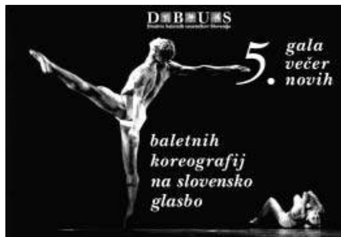
Plakat za 5. Gala večer – Oblikovalka Neva Štemberger

Za pomoč se zahvaljujemo tudi Ministrstvu za kulturo, mestni in občinski in operno-baletni gledališčema Ljubljane in Maribora, podjetju Rutar in številnim posameznikom.