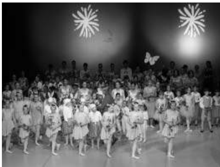
Člani Društva ljubiteljev baletne umetnosti Divača z gosti