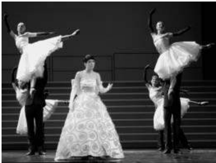
La Callas, prizor iz predstave