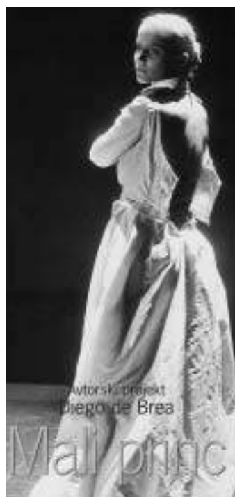
Tijuana Križman kot Mali princ