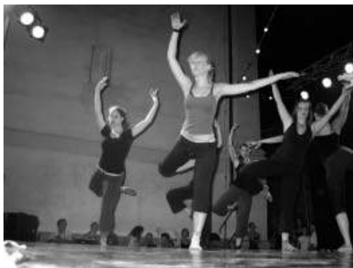
Zbliževanjem z baletom v Izoli