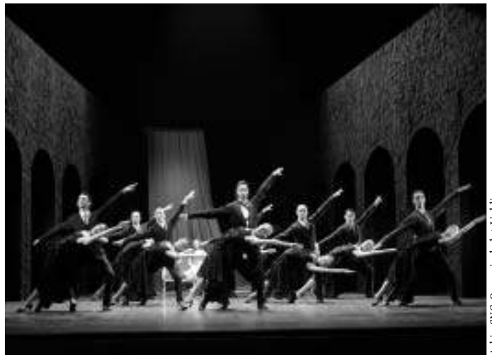
Romeo in Julija