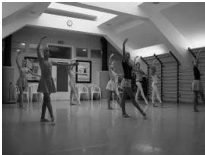
Učenke poletnega tečaja baleta v Naklem