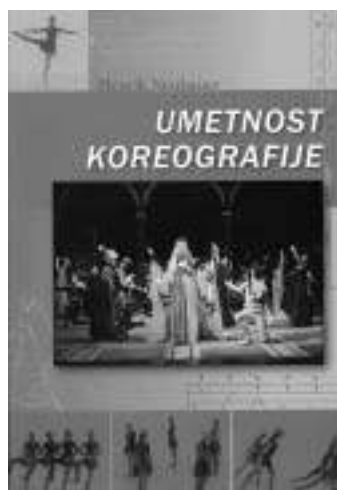
Umetnost koreografije - naslovnica

Informacije o knjigi so dostopne na naslovih: SNG Opera in balet, Slovenska 27, Maribor, tel.: 02/250 61 00 in Iko Otrin, Gosposvetska 19 B, Maribor, tel.: 02 241 45 48, e-mail: iko.otrin@kksonline.com).