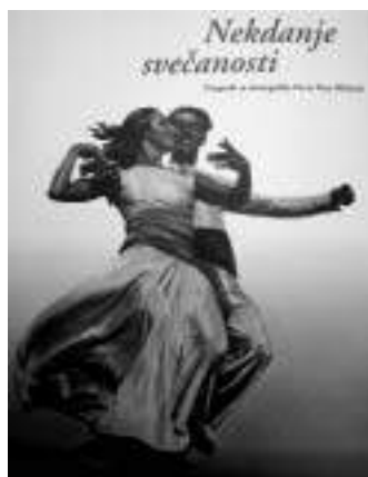
Nekdanje svečanosti - naslovnica, oblikovanje Neva Štemberger

Slovensko komorno glasbeno gledališče je izdalo knjigo spominov balerine Lidije Sotlar v uredništvu Henrika Neubauerja. Predstavitve v ljubljanskem opernem gledališču se je udeležilo veliko število njenih kolegov, prijateljev in znancev. Avtorica v svojih spominih najprej oživi svoje otroštvo, nadaljuje s srečanjem z baletnimi koraki, profesionalnim odrom in življe-