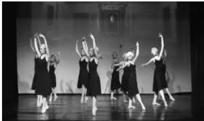
Allegro vivace – mlade »Mozartovke«