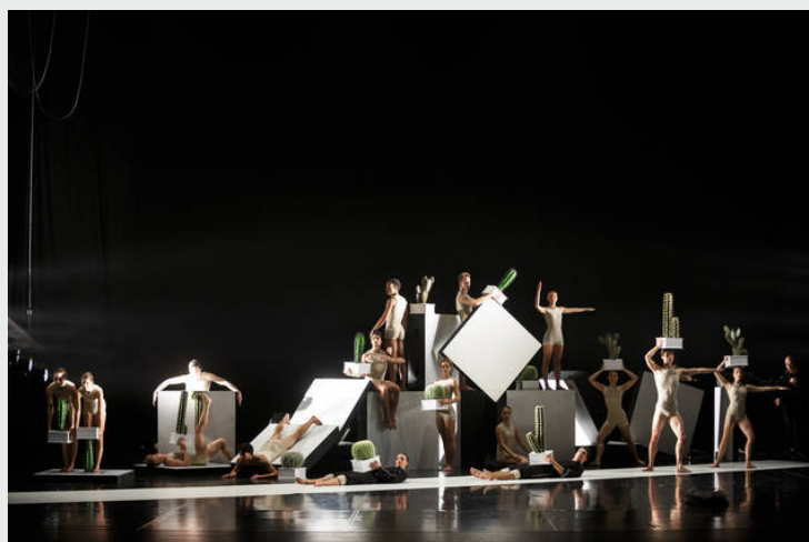
Balet Kaktusi, s katerim se je predstavil ljubljanski ansambel.

Ključne besede: Jugoslovanski balet, Ljubljanska Opera, Tomaž Rode