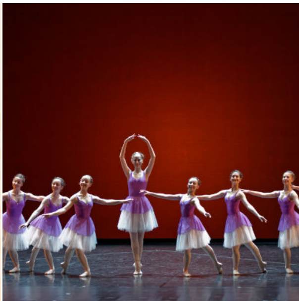
Valček iz baleta Raymonda: Konservatorij za glasbo in balet Ljubljana 5. b razred.