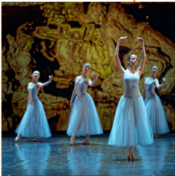
Baletna slovesnost se je začela s predstavo Valse Fresco v izvedbi Madega slovenskega baleta.

Na koncertu je Društvo baletnih umetnikov Slovenije podelilo strokovne nagrade Lydie Wisiakove zaslužnim baletnim umetnikom